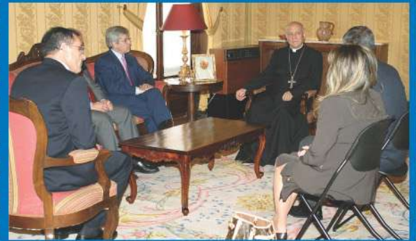
25-10-05 La Unión Iberoamericana de Padres de Familia, UNIAPA, se reúne con el arzobispo de Valencia para mostrar su apoyo al EMF.