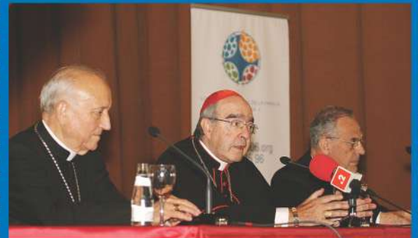
27-10-05 El cardenal Alfonso López Trujillo se reúne en el Seminario de Moncada (Valencia) con los sacerdotes y laicos de la diócesis para invitarles a participar en el EMF.