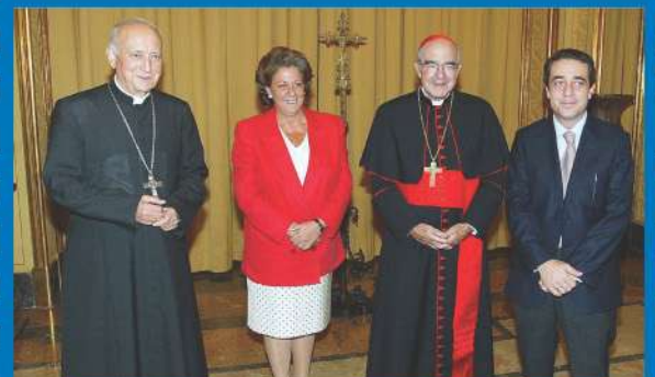
28-10-05 Reunión del patronato de la Fundación Comunidad Valenciana V EMF con el cardenal Alfonso López Trujillo.