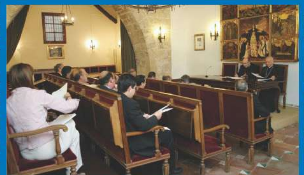
28-10-05 El cardenal Alfonso López Trujillo se entrevista con la Comisión Organizadora del V EMF.