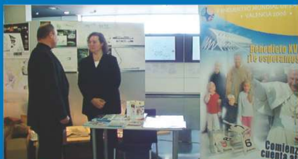
7 a 9-10-05 Promoción del EMF en el II Congreso Nacional del Foro Español de la Familia, en Madrid.