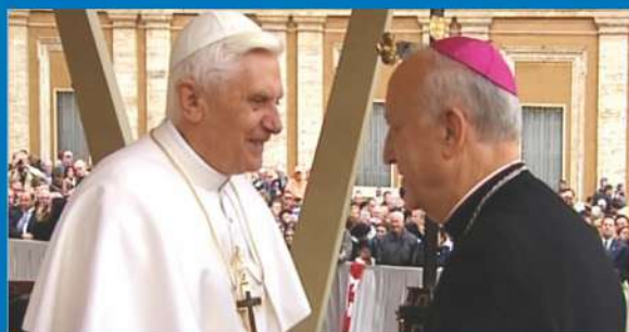
19 a 21 -10-05 El arzobispo de Valencia visita el Vaticano para informar de los preparativos del EMF.