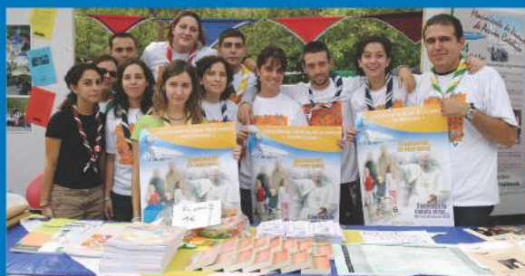
16-10-05 Promoción del EMF en la celebración festiva del X Aniversario del Foro Diocesano de Laicos en Valencia.