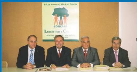
15-10-05 El EMF presente en la asamblea de la UNIAPA, Unión Iberoamericana de Padres de Familia, en Madrid.