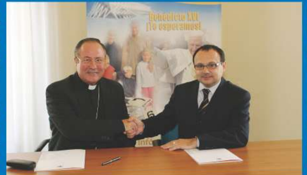
25-10-05 Firma del acuerdo por el que la empresa Cavaltour se convierte en agencia de viajes patrocinadora del EMF.